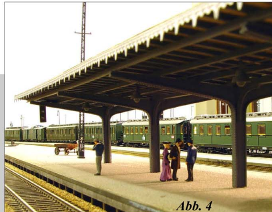
Abbildung 3 u. 4: preussische Bahnsteigüberdachung, Grundbausatz mit 4 Stützen für eine Länge von ca. 350 mm, Best. Nr.: 1688