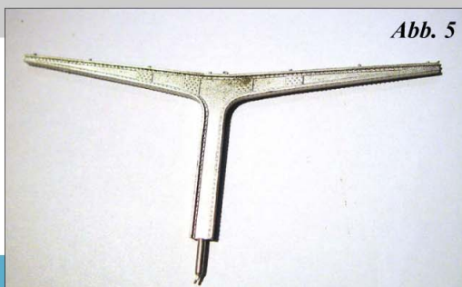
Abbildung 5: Erweiterungsstütze, 1 Stck. Weißmetall Best. Nr.: 1688 A