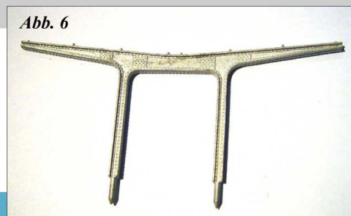
Abbildung 6: Erweiterungsstütze für Niedergang, 1 Stck. Weißmetall Best. Nr.: 1688 B