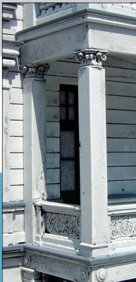
Abbildung 6: Eck-Kompositkapitell, 4 Stck. MS, Best. Nr.: 1760

Abbildung 5: Kompositkapitell halbplastisch, 8 Stck. MS, Best. Nr.: 1759